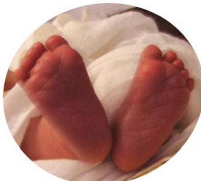
Sind die nicht süß?